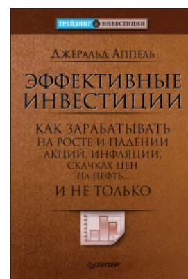
Эффективные инвестиции. Как зарабатывать на росте и падении акций, инфляции, скачках цен на нефть... и не только Джеральд Аппель

Во все времена финансовая сфера была окутана особой тайной. Многим людям всегда хотелось узнать, какими секретами пользуются настоящие профессионалы, удачно заработавшие свои миллионы. Как известно, отсутствие надлежащей психологической подготовки способно привести к убыткам, и это не придуманная проблема, а реальная опасность для успешной торговли. Возможно, некоторые получают ответ, изучив двенадцать непреложных законов, известных как «швейцарские аксиомы». По сути, это не просто свод правил, а ряд вопросов, на которые каждый начинающий и даже опытный спекулянт обязан честно себе ответить.